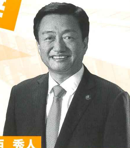
高松市長 大西 秀人