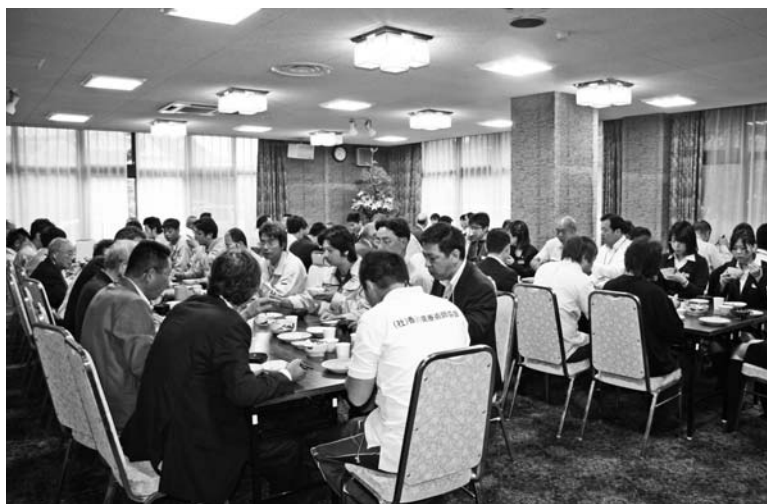
▲6月28日のモーニングセミナー後の食事風景。約70名の参加で1階は満杯状態となった。