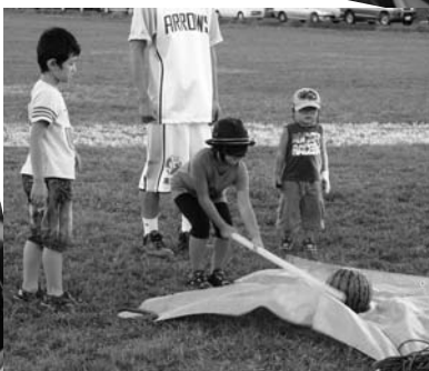
◀けっこう難しかったスイカ割り