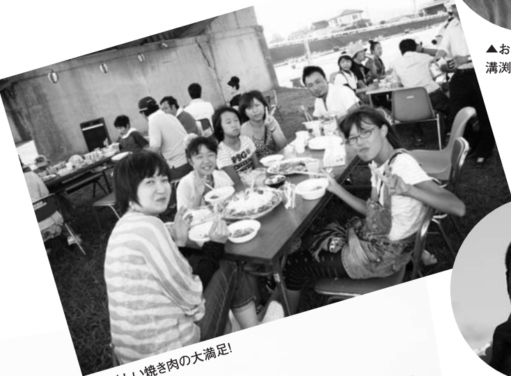
▲美味しい焼き肉の大満足!