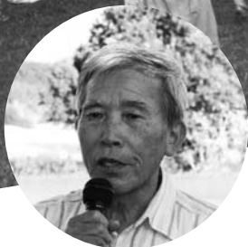
◀森勝一相談約による乾杯。