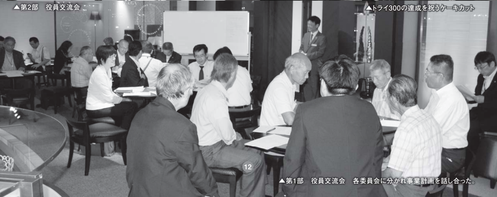
▲第1部 役員交流会 各委員会に分かれ事業計画を話し合った。