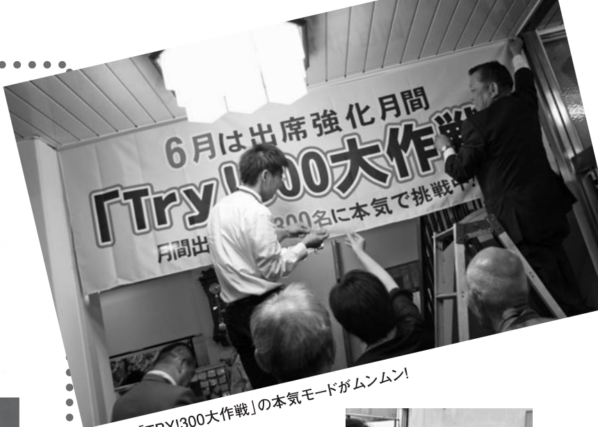
▲「TRY!300大作戦」の本気モードがムンムン!

▶6月14日は「TRY!300大作戦」の第2週目。今日は高松南の役員会を見たいということで、わざわざ徳島北倫理法人会から大勢お越しいただいたが、なんと恐縮にも朝食づくりまでお手伝いいただいた。遠慮のない高松南です。