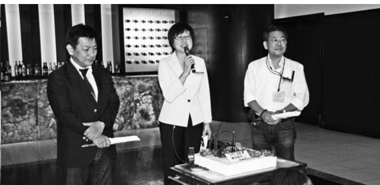
▲トライ300の達成を祝うケーキカット