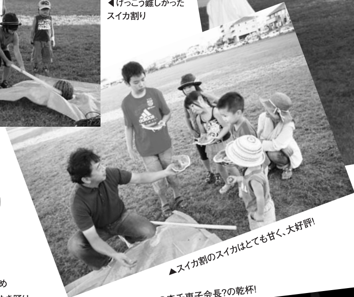
▲スイカ割のスイカはとても甘く、大好評!