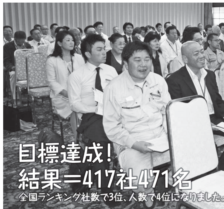
▲モーニングセミナーに出席いただいた未会員の方々