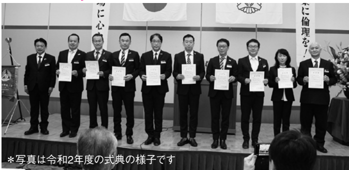
*写真は令和2年度の式典の様子です