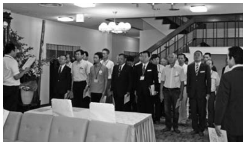
▲8月7日の役員朝礼風景