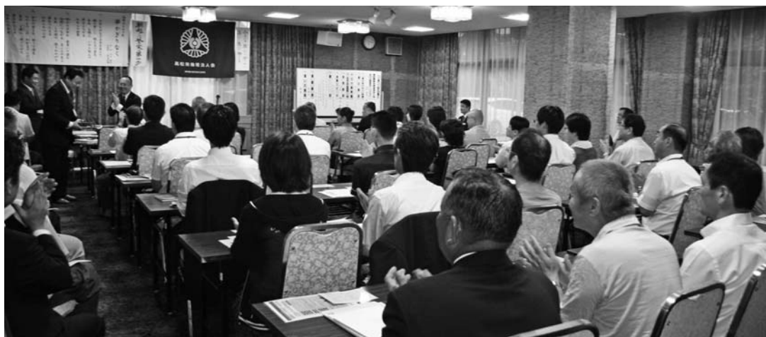
▲平成26年度年間会員出席率が全国3位になった高松南のモーニングセミナー。来年度から行動旗の色が変わるとのこと。

家庭の力を呼び戻す5つのポイントがあるので紹介します。①結束力・家族のつながり②共感力・思いやり③忍耐力・自分をセーブしコントロールする④思考力・テレビ主役の家庭に、真の団欒は生まれません⑤実行力・あなたが変われば家庭も変わる。倫理はすべてが実践、妻に感謝です。毎週木曜日朝6時から田村神社でお待ちしています。