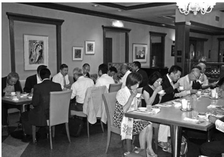
▲講話終了後、講師を囲んでシカさんの美味しいお食事タイム(¥1,000)。