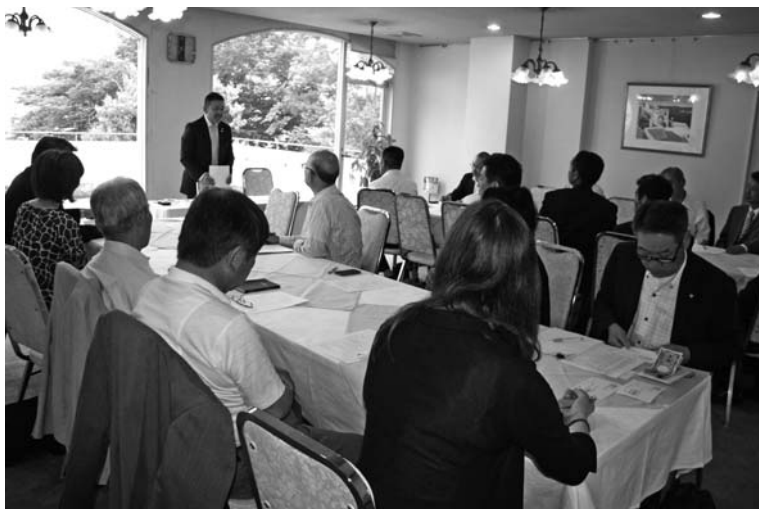
▲会員なら無料で参加出来ますので是非お時間の取れる方は参加ください。