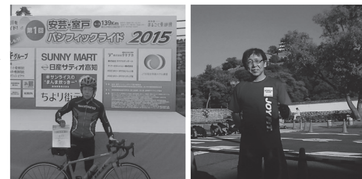
（※）従業員・役員が加入するイデコに企業が追加で掛金を拠出できる制度。企業の負担は掛金のみで運営管理手数料はかかりません。

「企業型確定拠出年金」の場合、「選択制」の制度設計により、加入者（従業員・役員）は掛金を税金、社会保険料の負担なく積み立てることが可能です。事業主は折半負担する社会保険料の負担軽減を期待できます。どちらの制度も加入者1名からの導入が可能ですので、お気軽にご相談ください。