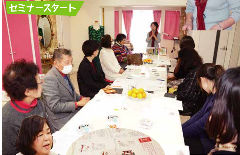
セミナースタート