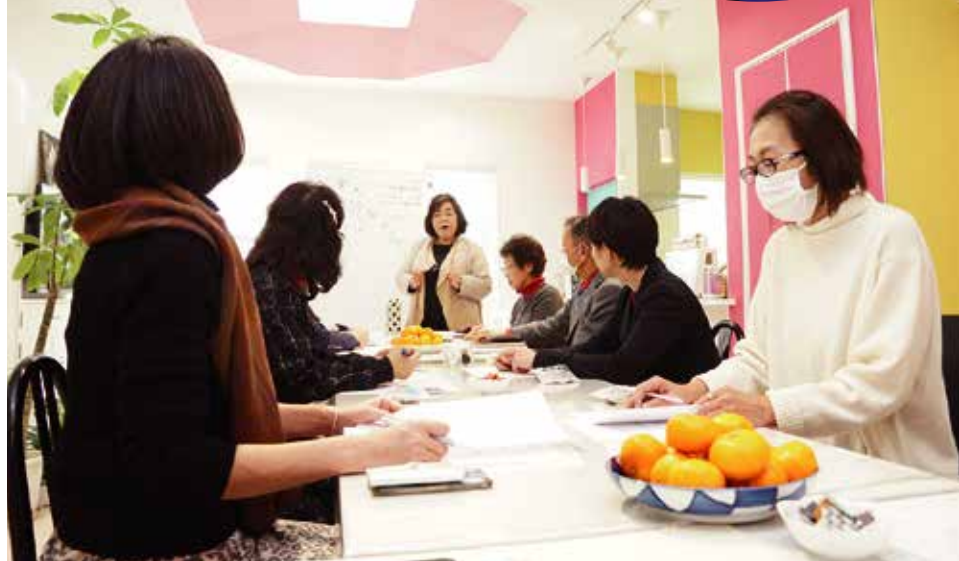
↑皆さん真剣にお話を聴かれていました。知っているのと知らないのでは大違いです。