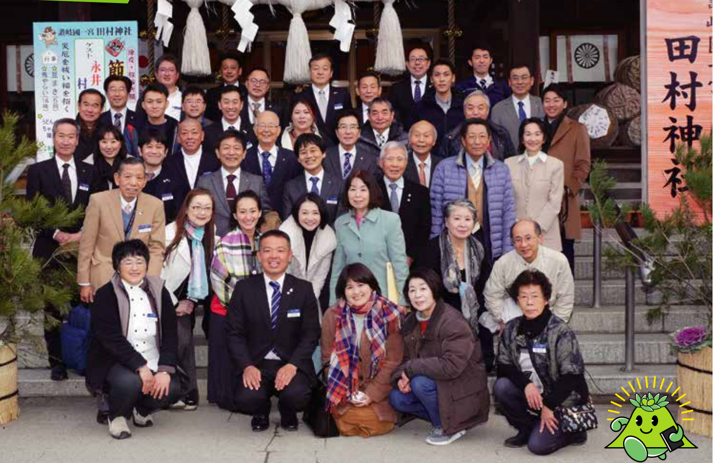
田村神社にて集合写真(1月9日)