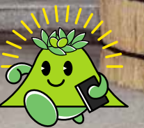
マスコットキャラクター「かりんちゃん」