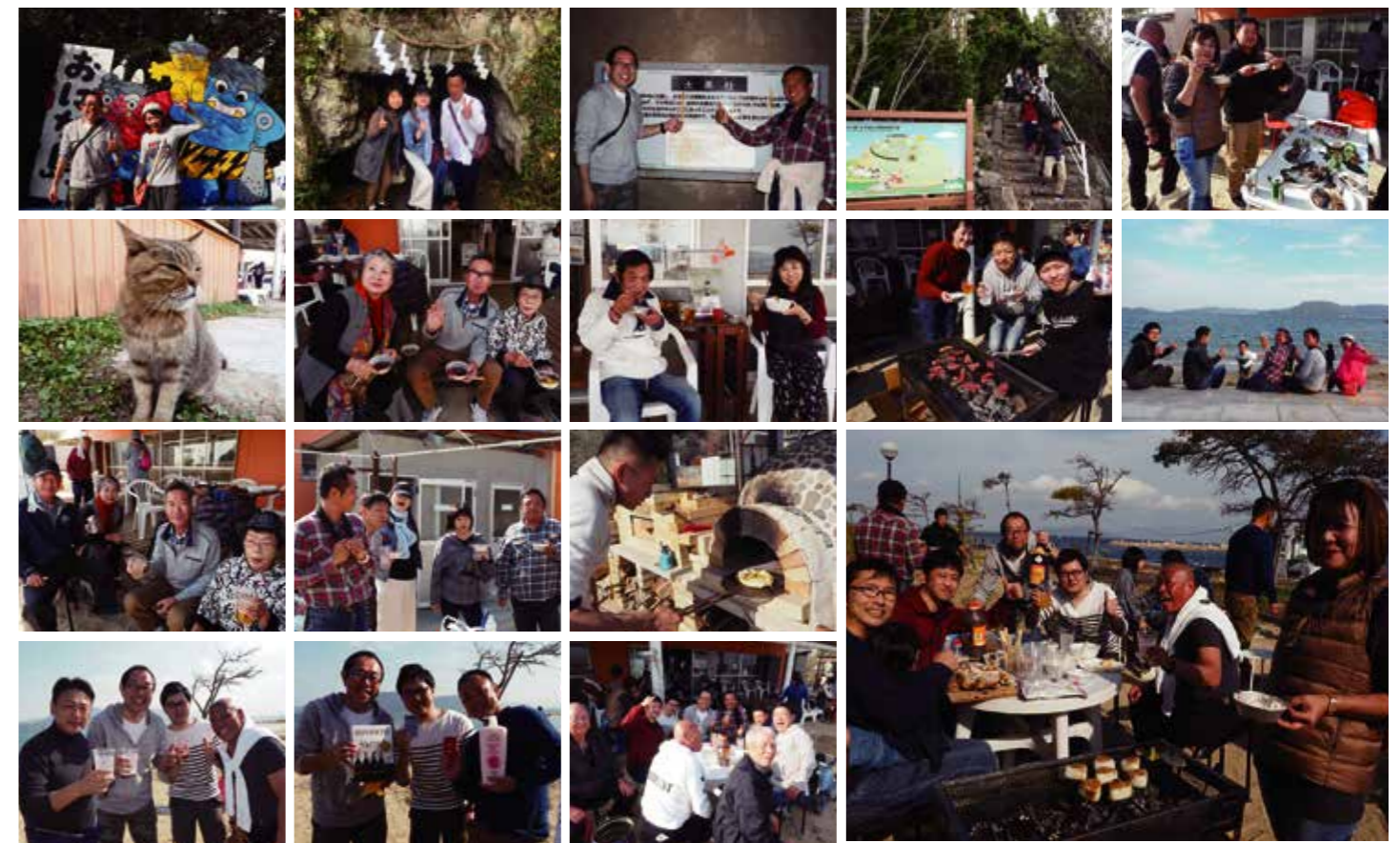
浜辺でも記念写真