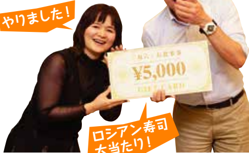
ロシアン寿司 大当たり!