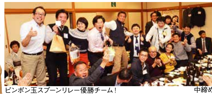
ピンポン玉スプーンリレー優勝チーム!