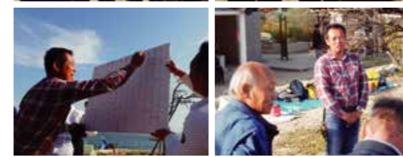
宝探しゲームスタート!