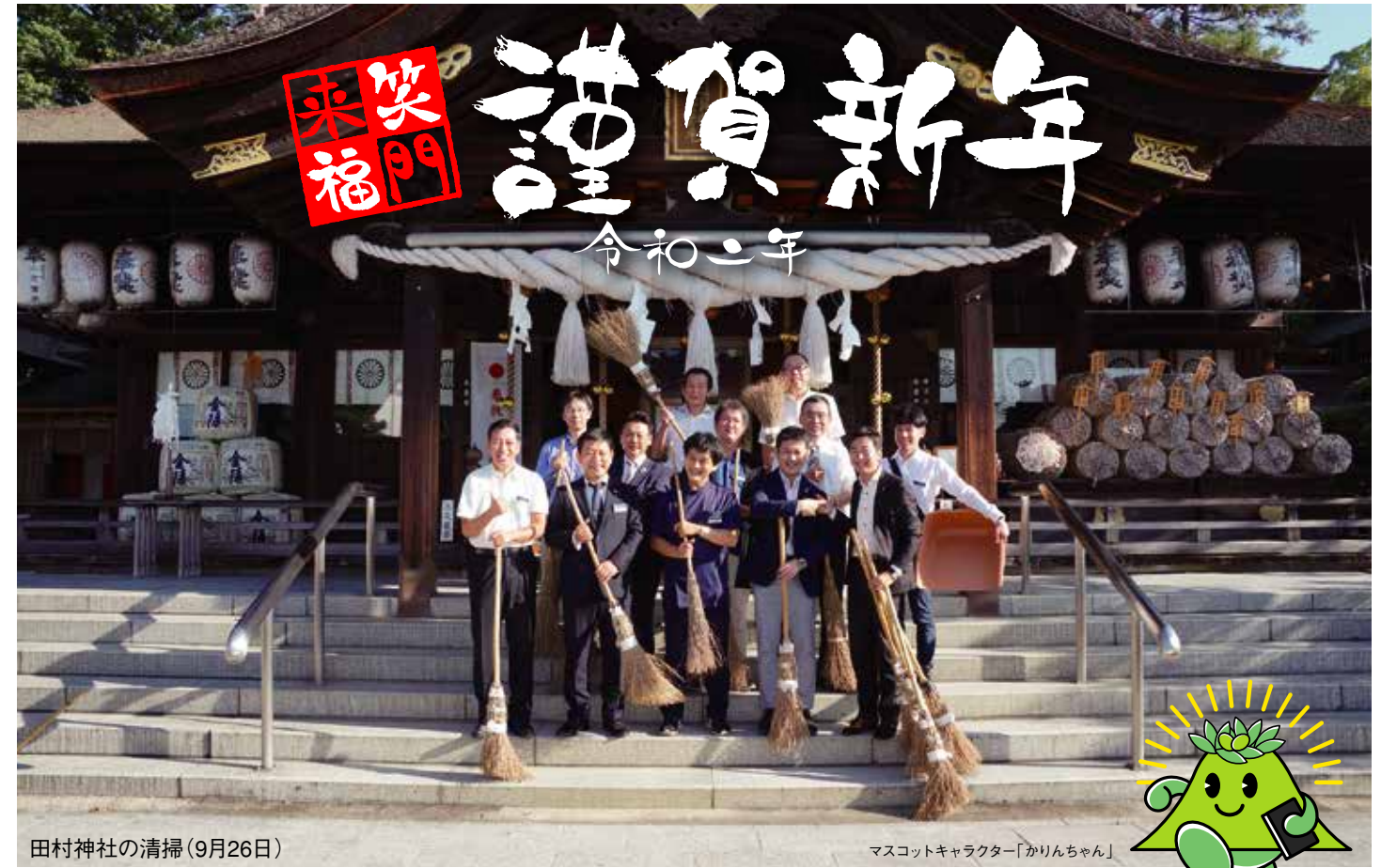
田村神社の清掃(9月26日)

発行/香川県高松南倫理法人会 〒760-0066 高松市福岡町2丁目3番4号 ホテルマリンパレスさぬき内 tel.087-813-1631 fax.087-813-1632 mail:rinri-ki@shikoku.ne.jp http://www.takamatsuminami-rinri.net/