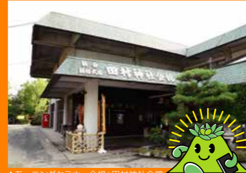
▲モーニングセミナー会場：田村神社会館