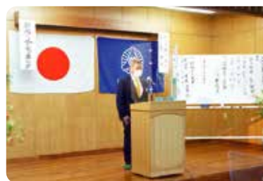
▲会員全員の決意発表!