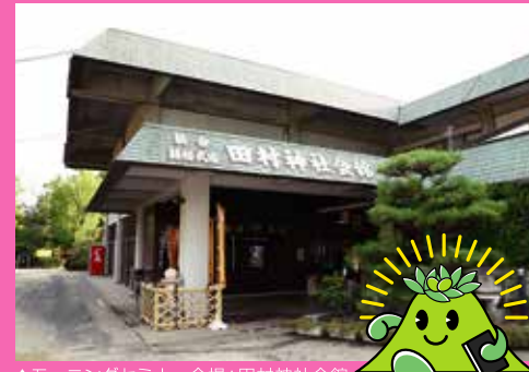
▲モーニングセミナー会場：田村神社会館