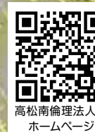
高松南倫理法人会 ホームページ