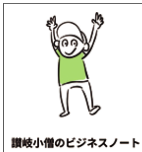
讃岐小僧のビジネスノート

香川では施策を通じてアクセスが10倍以上になったお客様や、業務システムを開発・導入して間接コストの削減に成功した事例もごさいます。