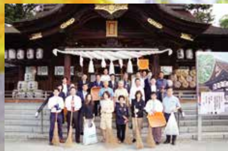
▲田村神社境内の清掃 9月22日(木)

発行／香川県高松南倫理法人会 〒760-0066 高松市福岡町2丁目3番4号 ホテルマリンパレスさぬき内 tel.087-813-1631 fax.087-813-1632 mail:rinri-kt@shikoku.ne.jp http://www.takamatsuminami-rinri.net/