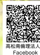
高松南倫理法人会 Facebook