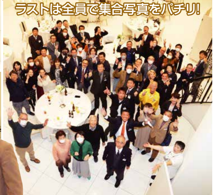
ラストは全員で集合写真をパチリ!