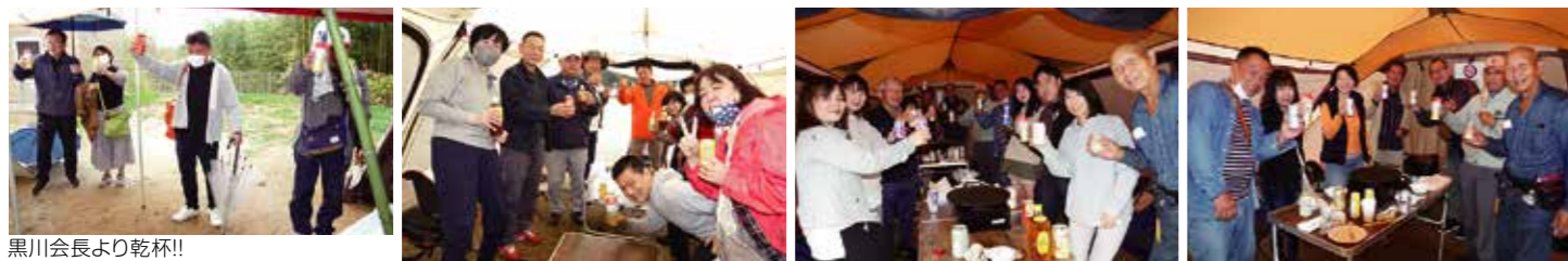
黒川会長より乾杯!!