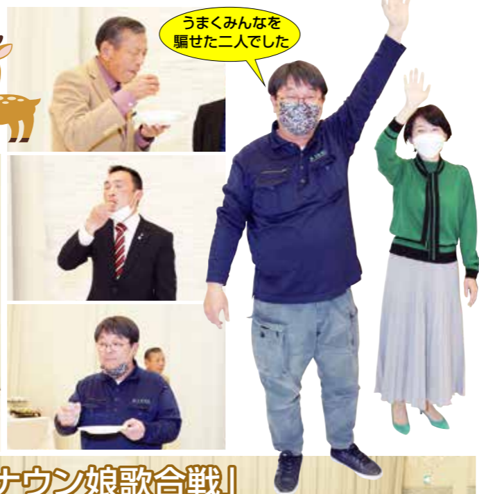
うまくみんなを 騙せた二人でした