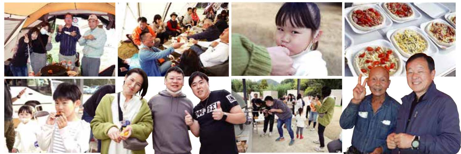
熱々のピザを 作りました!!