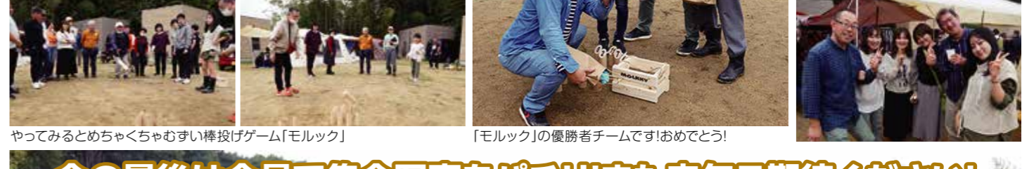
やってみるとめちゃうくちゃむずい棒投げゲーム「モルック」