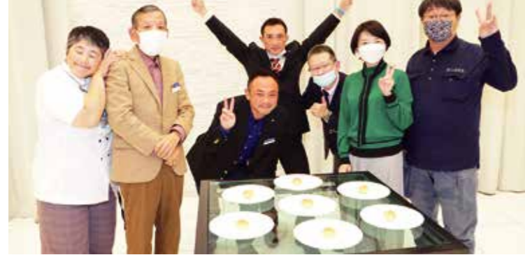
MSチームの「ロシアルーレット」