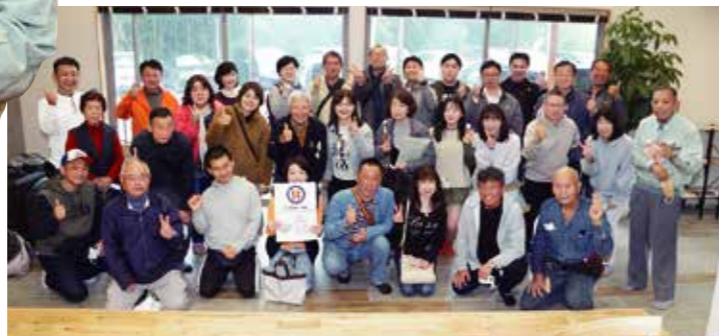
バンズの会のスタートは雨だったため、まず室内での集合写真をパチリ!