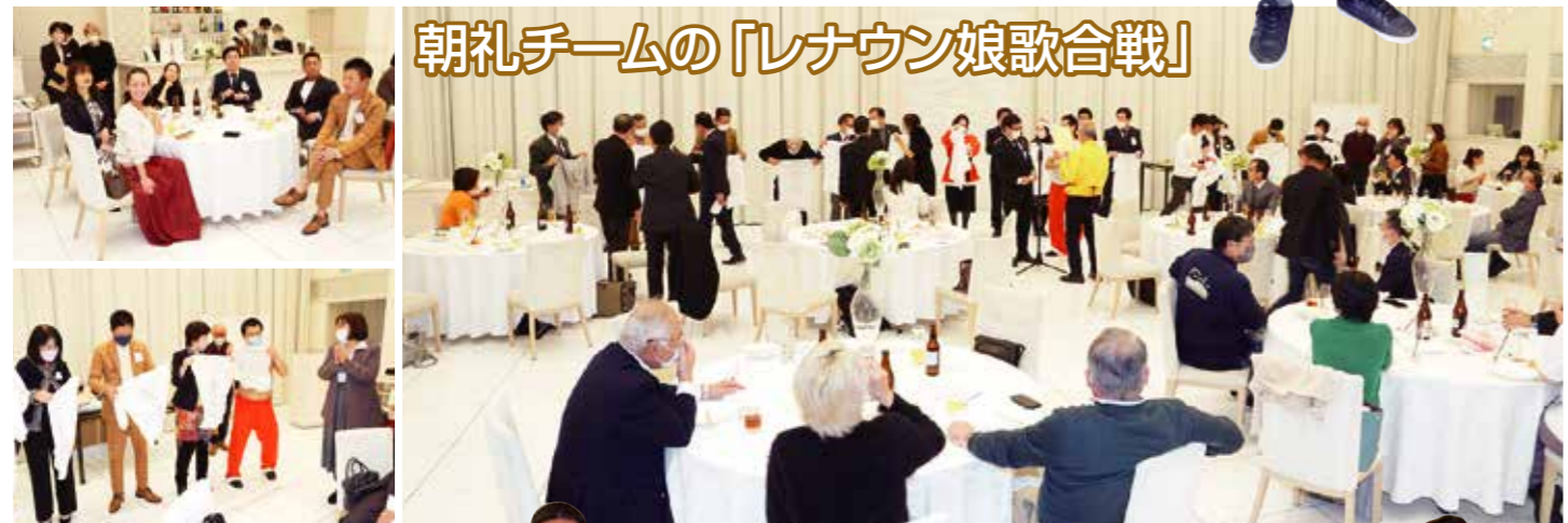
朝礼チームの「レナウン娘歌合戦」