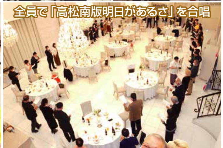
全員で「高松南版明日があるさ」を合唱