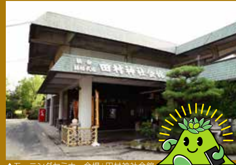
▲モーニングセミナー会場：田村神社会館