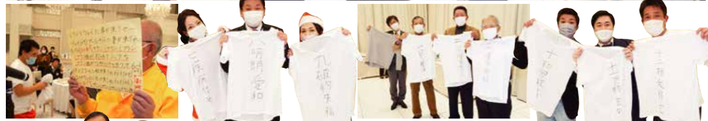
全総合優勝チームに壹萬円!!