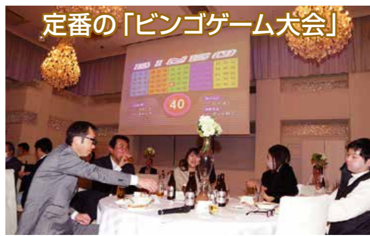
定番の「ビンゴゲーム大会」