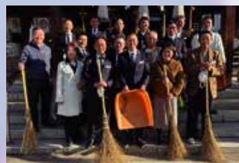
▲田村神社境内の清掃 3月16日(木)

信成万事 信ずれば成り、憂えれば崩れる 自信のないことは失敗する。憂え心を抱いて弱気になると、物事はうまくいきません。きこいできるという信念が、そのことを成就させます。信は力なのです。