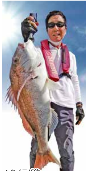
▲タイラバ釣 2022・10・31日小与島沖 で釣れた80cmの真鯛。