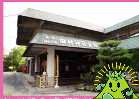
▲モーニングセミナー会場：田村神社会館