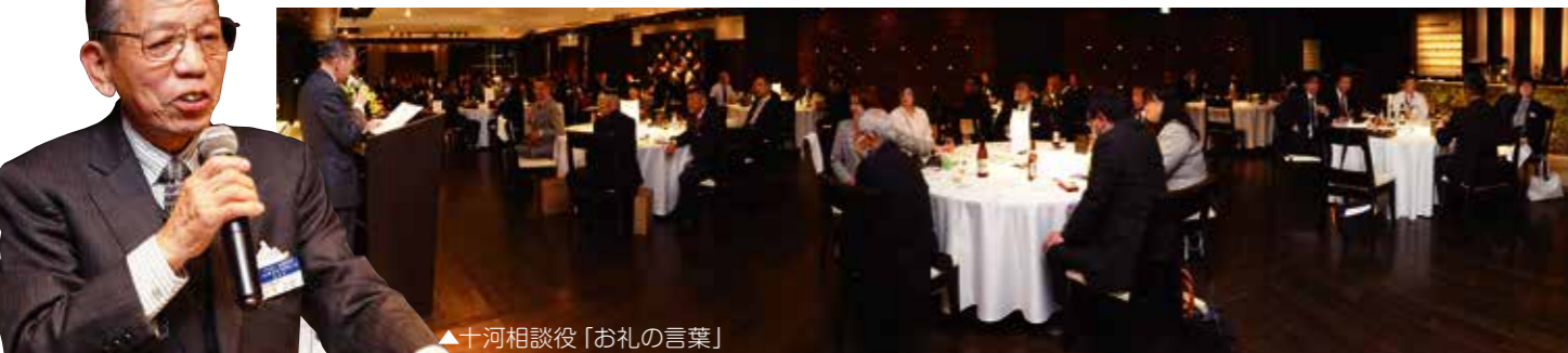
▲十河相談役「お礼の言葉」