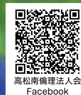
高松南倫理法人会 Facebook