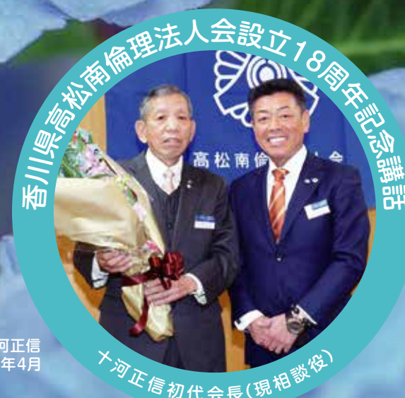
香川県高松南倫理法人会設立18周年記念講話