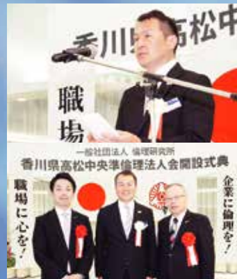
▲6月18日(木) 香川県高松中央準倫理法人会 開設式典

尊己及人 己を尊び人に及ぼす 世の中にたった一つしかない宝といふべき自分の個性をできるだけ伸ばして、世のため、人のために働く。それが自分を尊ぶこととなります。人の喜びをわが喜びに、人の悲しみをわが悲しみとする境地が開けるのです。