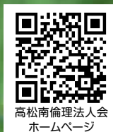
高松南倫理法人会 ホームページ