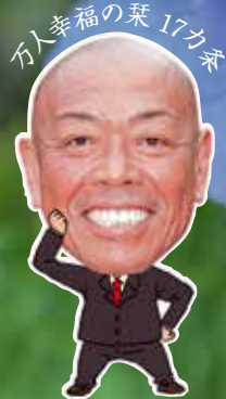
石川幸福の葉 17カ条

尊己及人 己を尊び人に及ぼす 世の中にたった一つしかない宝といふべき自分の個性をできるだけ伸ばして、世のため、人のために働く。それが自分を尊ぶこととなります。人の喜びをわが喜びに、人の悲しみをわが悲しみとする境地が開けるのです。