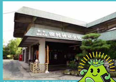
▲モーニングセミナー会場：田村神社会館