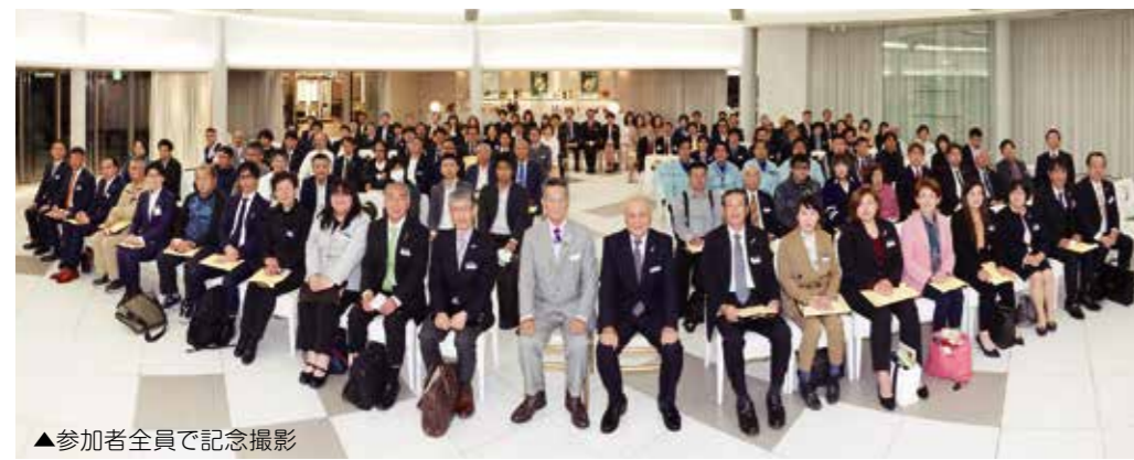
▲参加者全員で記念撮影