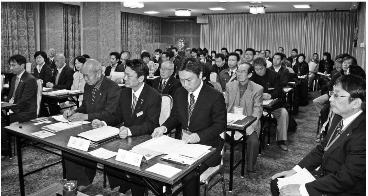
2月16日のモーニングセミナー風景。参加者は63社67名でここ数ヶ月毎回60名～70名の参加となっている。