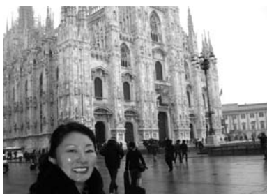
▲イタリア ミラノドゥオーモにて

ハワイ、韓国は大好きです。去年はイタリア、台湾、そして韓国に行きました。イタリアでは歴史を感じる建築物に感動!!また、パスタは前菜で、メインのお料理がどっさり出てくるのにびっくり!良質の皮バッグやブーツは今もお気に入りです。台湾はずーっと雨でした。た