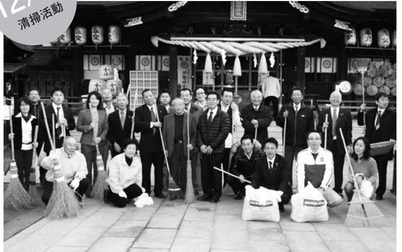
▲モーニングセミナー、食事終了後、毎週お世話になっている田村神社境内を清掃した。