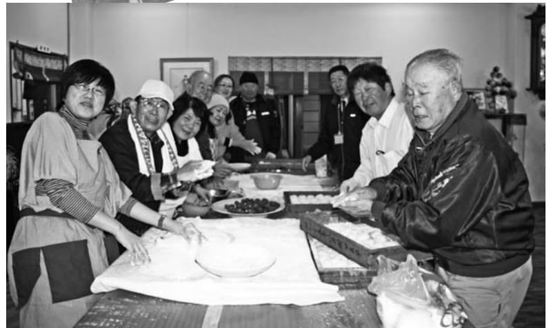
▲年に1度の恒例行事となった餅つき。今日は早朝?(深夜)2時30分からワイワイ、ガヤガヤ、皆でお餅をついて、皆で丸く丸めて大騒動。途中温かくて柔らかいお餅がおいしそうでついつい度々の試食で朝食前には、お腹がいっぱい!モーニングセミナー終了後、みなさん1パックずつお持ち帰りいただきました。