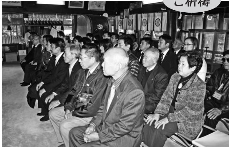
▲新年式終了後、田村神社本堂でご祈祷していただきました。