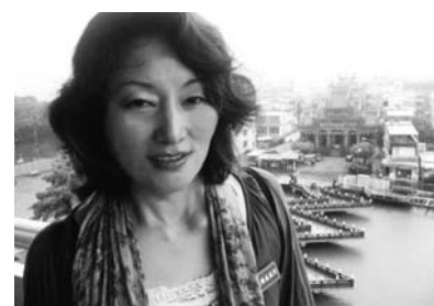
▲台湾 蓮池潭(れんちたん)にて