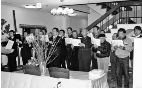
いつも30名を超える高松南の役員朝礼風景。(2月23日)