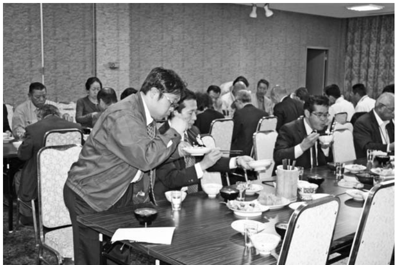
2 ▲朝食風景 高松南の手作りの朝食はとても美味しいと評判です。まだの方は是非、食べてみてくださいね。

儲けるから儲かるへ 人に、「あの人はいいよ」と言ってもらえるようになると自然と儲かる。