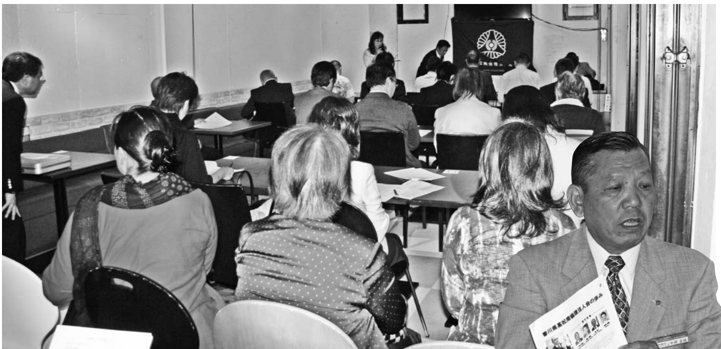
▲5月19日の新入会員オリエンテーション風景(鍛冶屋町ラ・トラッターレにて)