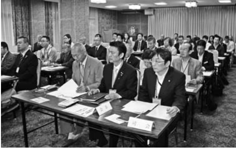
モーニングセミナー 風景。(5月17日)