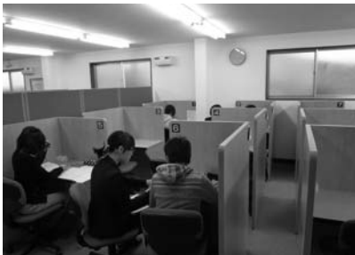
▲個別指導の学習の様子です