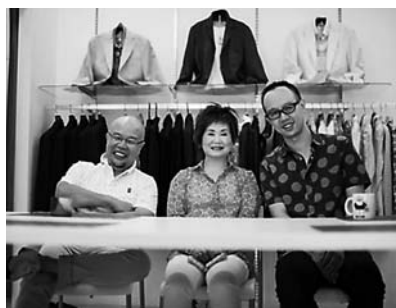
▲店内で家内と息子と

があります。「妙に肩が凝る」とか、 大は小を兼ねるではないが、ブカ ブカして服が泳いでいる状態、背 中の衿の下に段しわが出ている etc.これらは体に合っていない症 状の一つです。