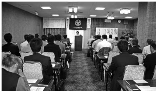
▲5月15日のモーニングセミナー風景。3月のM.S出席率は全国670単会中4位でした。