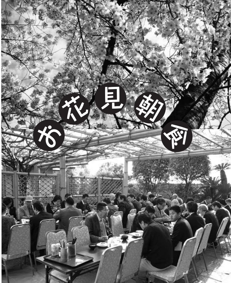
▲4月3日モーニングセミナー終了後の朝食は桜が満開の庭で手作りお寿司と温かいお味噌汁。花見朝食は高松南の恒例行事。もう少し暖かくなったら藤棚の下での朝食が楽しみです。