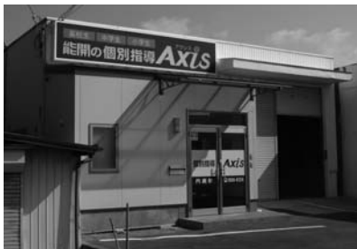
▲真新しい校舎です

ということです。大人もそうですが、子供たちも日々、学校や家庭で多くのストレスを抱えながら過ごしています。そんな毎日の中、塾にくることで、ちょっとした何気ない話を聞いてくれる、学校や家庭であった不満を吐き出すだけで少し気持ちが楽になったりするものです。そういうほっとできる空間にしたいという思いがあります。