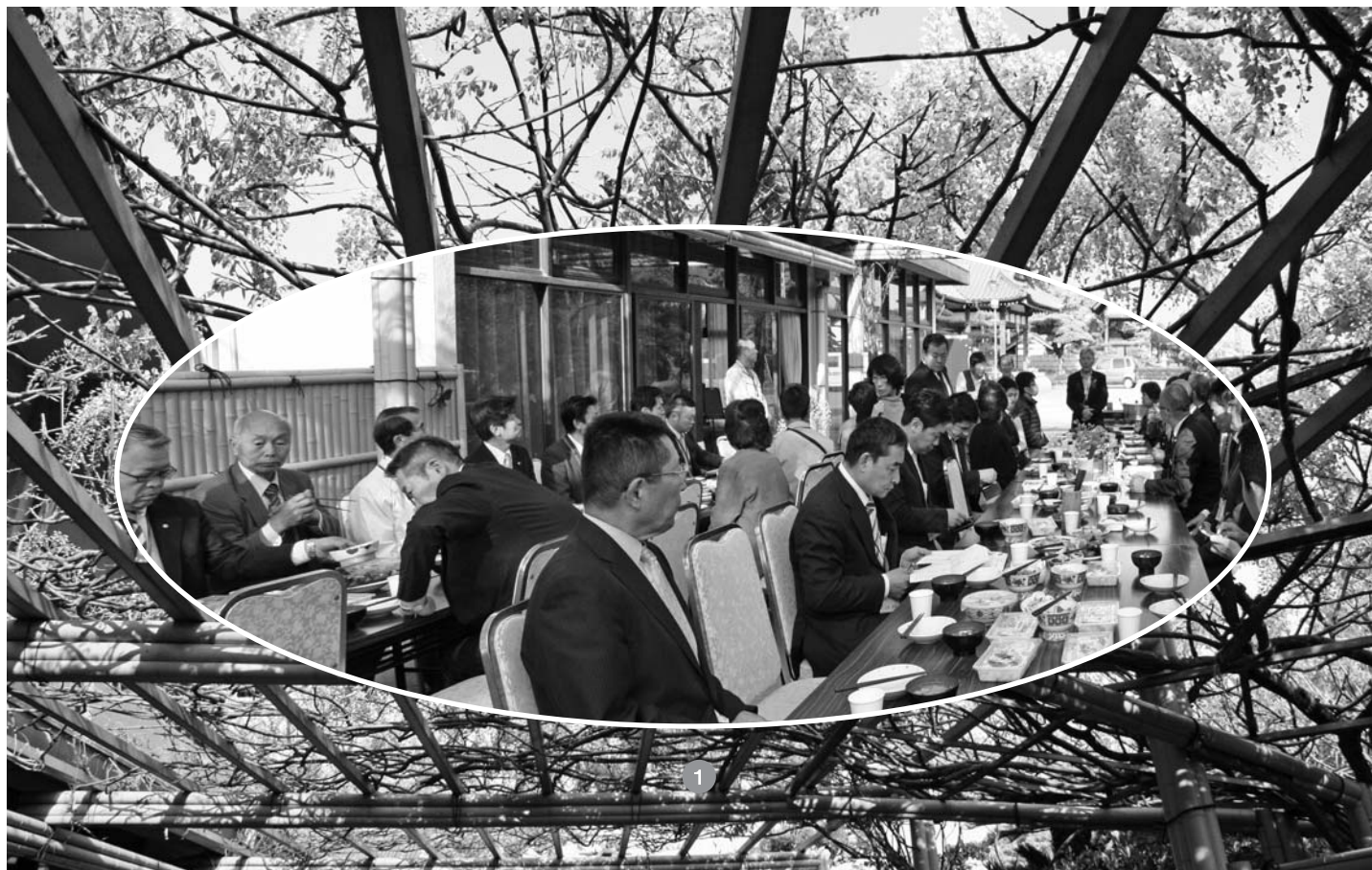
▼4月24日モーニングセミナー終了後の朝食は屋外の藤棚の元でおいしくいただきました。

高松南倫理法人会では毎週木曜日に田村神社で朝6時からモーニングセミナーを行っています。さまざまな分野の一流の講師陣に、朝から志高くテンションを上げて教えていただきます。業界の裏話や秘話を教えて下さる先生や、古事記等の歴史ものをわかりやすく教えて下さる先生もいらっしゃいます。中には、整理方法を通して心の整理まで考え方を昇華された先生もいらっしゃいました。学び続けて知識を蓄えそして経験を積んで知恵となります。まさに『知恵のおもちゃ箱』。高松南倫理法人会ではそんなモーニングセミナーに毎週チャレンジしています。『早起きは三文の徳』という諺もありますが(当時の三文は現在の100円位だそうです)、それどころではありません。人生を変えるほどの力があると思います。事実私には十分な意味と価値がありました。また講演終了後には温かい手造りの朝食がみなさんをお待ちしています。若手経営者、後継者のみなさん、毎週木曜日朝6時に田村神社にて是非とも倫理経営を覗いてみませんか。