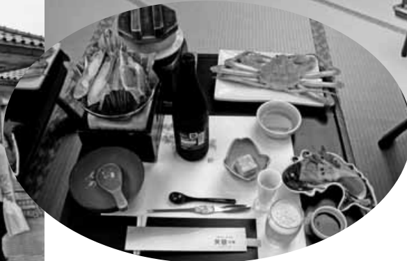
▲カニのフルコースをいただき、満腹!