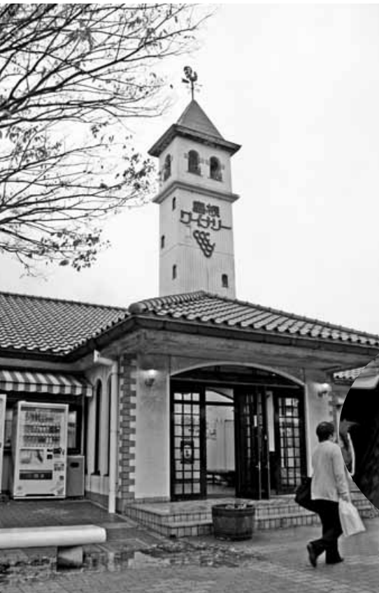
▲大型バスが10台以上並ぶ島根ワイナリー。 訪れる観光客は出雲大社とセットになっているみたいで、 ものすごい人の数にびっくり!