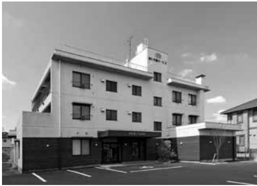
▲デイサービス学び舎こくぶんじ

まず、“(株)あい介護サービス” についてご紹介します。2002年 に訪問介護事業所からスタートし、 経営理念でもある“被介護者と介