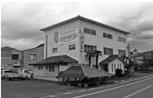
▲(株)高松セラミックス社屋

して屋根瓦の施工を担当しております。多くの大型物件・神社・仏閣を手掛けてきましたが、この仕事をしていて良かったと思う事は、雨漏りと修理です。これで大丈夫ですと言いつつ、その時の施主の安堵した顔を見るのが私の幸せな瞬間です。