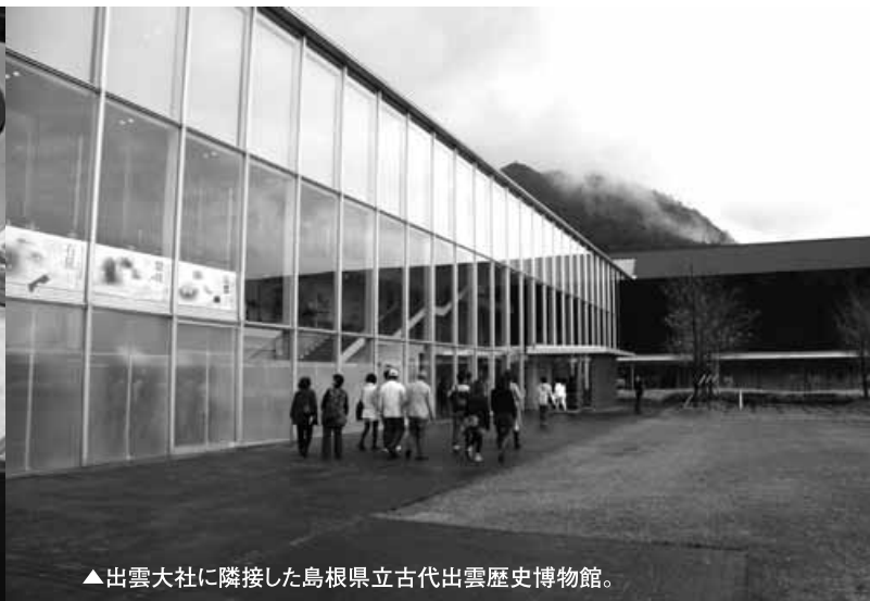
▲出雲大社に隣接した島根県立古代出雲歴史博物館。