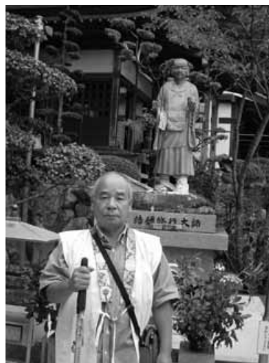
▲四国八十八か所・結願寺 大窪寺にて

を週1~2回行っている。どちらにしても年寄りじみているがこれも年齢か?石の上にも3年という言葉がある。自分に都合よく考えれば、そろそろ道の出口がみえてくる筈だ。もしかして、今思っていることが出口への道なのか?万人幸福の栞17か条に答えがあるような気がする。