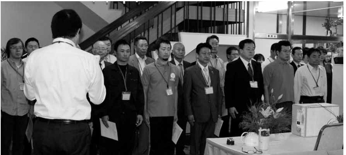
▲10月10日の役員朝礼風景。今日は他単会のメンバーの方も参加されたこともあって、約40名の役員朝礼となった。

静岡県御殿場市に富士高原研修所(略して富士研)があります。世界遺産に登録された富士の雄大な自然に囲まれ、より深く倫理について学習できる最高の施設です。その入口に「責め心のない厳しさ 馴れ合いでない優しさ」と大きく書かれた書が掛けられています。この想いをバックに富士研修に参加された多くの方々が人生の転機となるかも知れない重大な気づきを持ち帰り、新たな自分にチャレンジしようと決意、覚悟を決め旅立ちます。この富士研の空気を私たちにとって身近な田村神社で再現したいと願いながら毎週行われているのが高松南倫理法人会のモーニングセミナーです。朝5時頃からその『場創り』は始まります。スリッパを並べ、行動旗を掲げ、糸をはって机を真っ直ぐに並べる、配布資料を寸分違わず並べて今日来られる倫友を待つ至福の時間でもあります。せっかくお越しいただけるのだから最高の気持ちで、多くの気づきを持ち帰って頂ける道場を幹事さん全員で力を合わせて創るのです。「企業に倫理を、職場に心を、家庭に愛を」をスローガンに切磋琢磨する倫友の姿があります。お互いを認め合った倫友の笑い声で一杯となった活力溢れる高松南倫理法人会のモーニングセミナーに是非とまでご参加下さい。